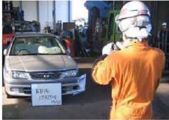
実績記録を補完する写真のイメージ