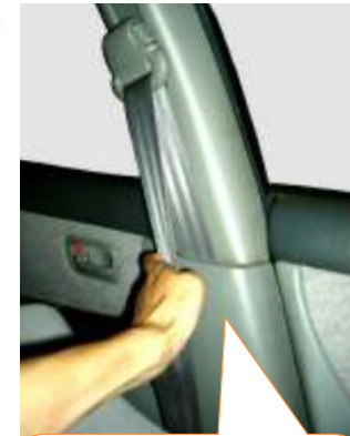
プリテンショナー 作動済とわかる 写真